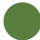
Verde opaco 6017